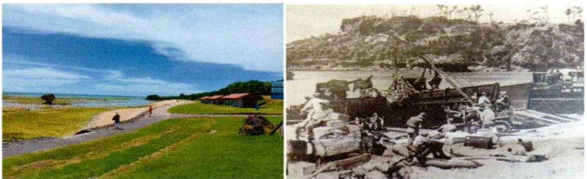
左写真は2025年6月中村が撮影した渡具知浜です。右写真は2025年5月18日付琉球新報小中学生新聞から転載の同じ渡具知浜での米軍上陸風景です。