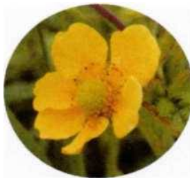
オオダイコンソウ