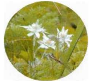
礼文ウスユキソウ