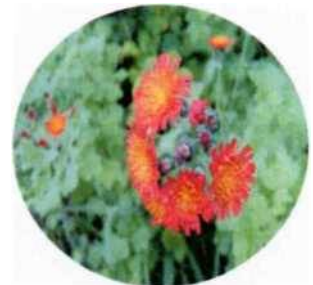
コウリンタンポポ