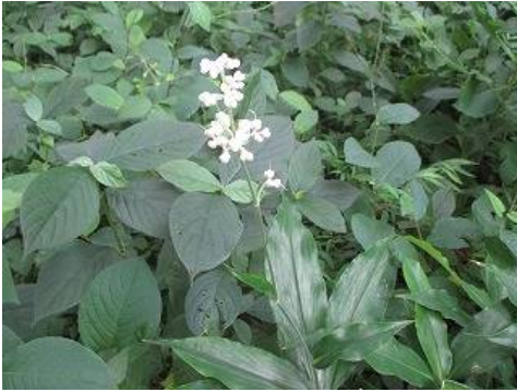
ヤブミョウガ (ツククサ科)