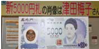
小平市では、新5000円札にちなんだ顔出しパネルも展示した。パネルは、8月31日(土)まで、中央公民館で展示中

小平市に縁のある津田梅子が新5000円札の肖像に採択されたこともあり、この夏、小平商工会では、市内参加店舗でビスの提供などが対象のレシートを5000円分集めて応募すれば、抽選で5000人に5000円分の賞品が当たる「新5000円札を貼付し、小平商工会まで郵送持参。用紙は特設サイトからダウンロードできる。受付は9月27日(金)までの予定。応募は、専用用紙にレシートを貼付し、小平商工会まで郵送持参。用紙は特設サイトからダウンロードできる。受付は9月27日(金)までの予定。