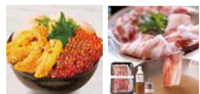
写真はイメージです。賞品の希望がある場合はご明記の上、ご応募ください

タウン通信から夏のお土産です。今年北海道からイクラ・ウニ・ホタテの3色丼。鹿児島県からかきま黒豚を用意しました。それぞれ抽選で1名様にお贈りします。 応募はウェブかほかは、住所、氏名、電話番号、年代、タウン通信が届いた日を