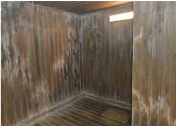
重監房の内部。上部に、小さな明かり取りがあるだけで、電灯もなかった。壁面に落書きが残る。壁の力ビまで再現している。明かり取りのある位置の床に用場があり、ふたがされている(※写真は特別にストロボを使用して撮影)