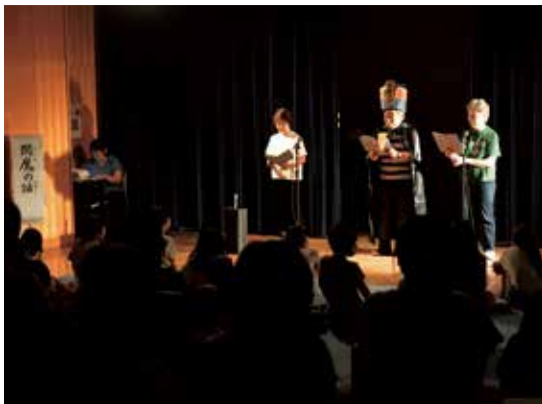
「閻魔の話」を読む朗読「草の会」のメンバー。中央男性の閻魔大王の帽子も、中高生ボランティアが作製した。7月25日、西東京市ひばりが丘公民館で