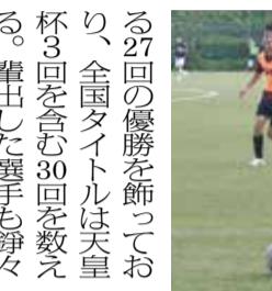
練習風景。東伏見キャンパスで

東伏見で90年超 大学の枠を超え、日本サッカー界を牽引してきた早大ア式蹴球部が東伏見を拠点としたのは1930年(昭和5年)のこと。以降、地域に溶け込み、現在でも近隣小学校でサッカー