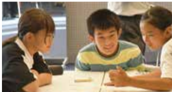
出入口には、廃病院の雰囲気を出すオブジェが...

東京都ひばりが丘公民館で開かれた。前に4年連続で実施されていたイベントを6年ぶりに復活させたもの。今回は中高生がボランティア参加し、会場の飾り付けを「こわーい」雰囲気仕上げた。ボランティア参加したのは、保谷高校、ひばりが丘中学校、田無第二中学校の美術部員などの有志計57人。会場入り口付近を廃病院に仕立てるなど、小学生たちを震え上がらせる工夫を随所に凝