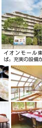
イオンモール東久留米そば。充実の設備が好評だ